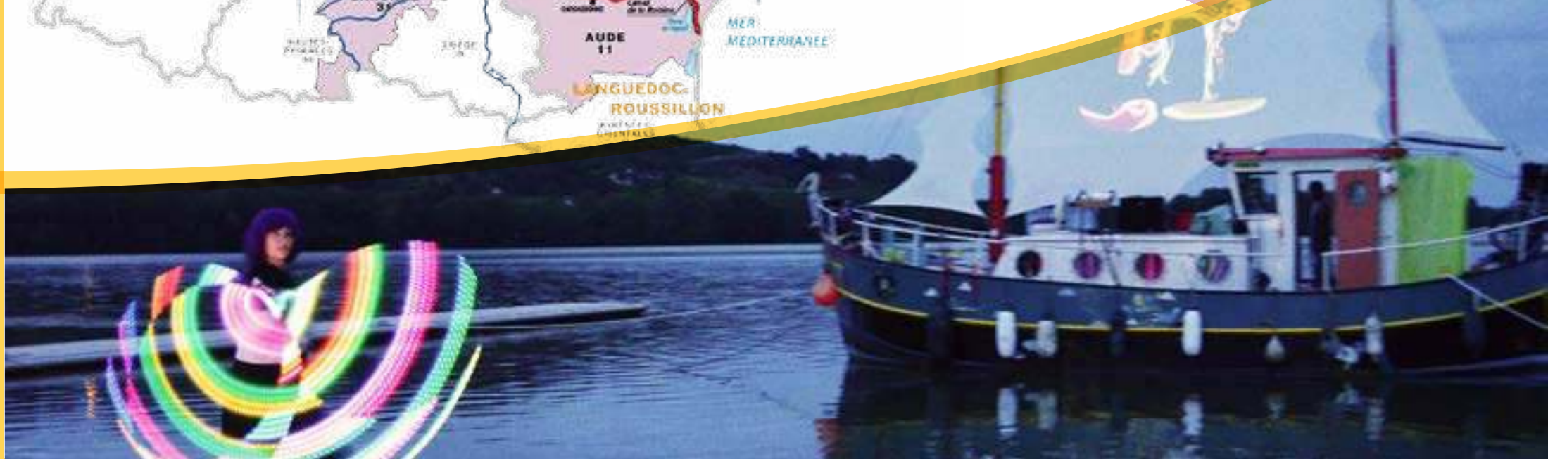
en haut à droite / en bas